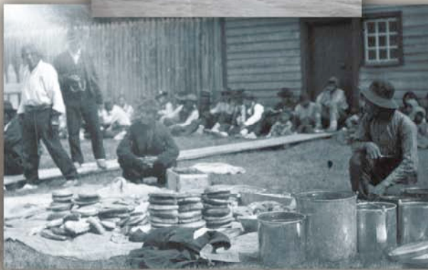
Preparing the feast to be held after the James Bay Treaty signing ceremony, Osnaburgh House, July 22, 1905