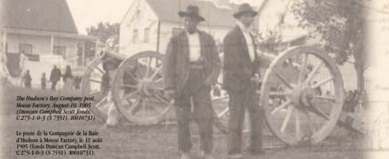
The Hudson's Bay Company post, Moose Factory, August 10, 1905

Préparatifs de la fête suivant la conclusion du premier accord du Traité n° 9 au poste de traite d'Osnaburgh House, au lac St. Joseph (rivière Albany).