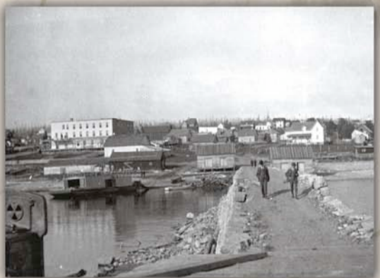
The Village of Haliburton, September 6, 1905 (Duncan Campbell Scott fonds, C.275-1-0-3 (S.7587), 0010729) Le village de Haliburton, le 6 septembre 1905 (fonds Duncan Campbell Scott, C.275-1-0-3 (S.7587), 0010729)

Moose Factory was one of the oldest and most important centres of the fur trade in what is now northern Ontario. Originally founded in 1673, Moose Factory acted as a regional administrative, supply and shipping centre for other posts built on the tributaries of the Moose River.