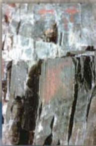
Indian pictograph site in Ferris Lake, Mood Township between Mattagami Lake and Matachewan, September 26, 1958

In addition to archaeological sites, rock paintings provide visually striking evidence of Aboriginal occupation. Aboriginal pictographs depict various aspects of life, and of spiritual relationships to animals and places.