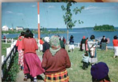
Members of the Fort Hope Band watching a float plane arrive at a landing dock at Lansdowne House at Treaty House, June 1956

Le jour anniversaire du traité, qui commémore le jour où des ancêtres des Premières nations ont signé le Traité n° 9, est une importante confirmation annuelle symbolique des rapports établis par le traité.