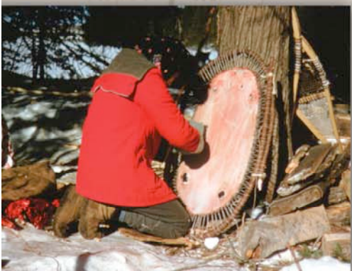
Woman of the Echum family fishing a bowen jelt and sculpting it during the 'frost drying' process, near Gogama, 1955