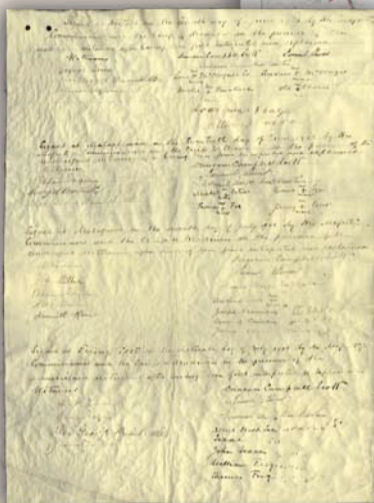
James Bay Treaty (Treaty No. 9), page 5, Miscellaneous collection, F.775. (1905) Item 13