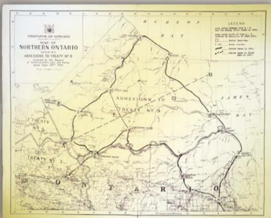
Map of Northern Ontario showing adhesions to Treaty No. 9 covered by the Report of Commissioners Gair and Avery, Aug. 30, Ontario Department of Surveys, 29 Sept. 1930

Une Cree répare un filet maillant à sa maison dans les années 1950.