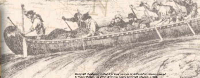
Photograph of a canoeing entitled: A fur trade canoe on the Mattawa River, Ontario, [retained by Francis Hopkin, [ca. 1890] (Archives of Ontario photograph collection, S.18096, 0014668) Photographie d'un dessin intitulé: A fur trade canoe on the Mattawa River, Ontario, [retained by Francis Hopkin, [vers 1900] (collection de photographies d'Archives publiques de l'Ontario, S.18096, 0014668).