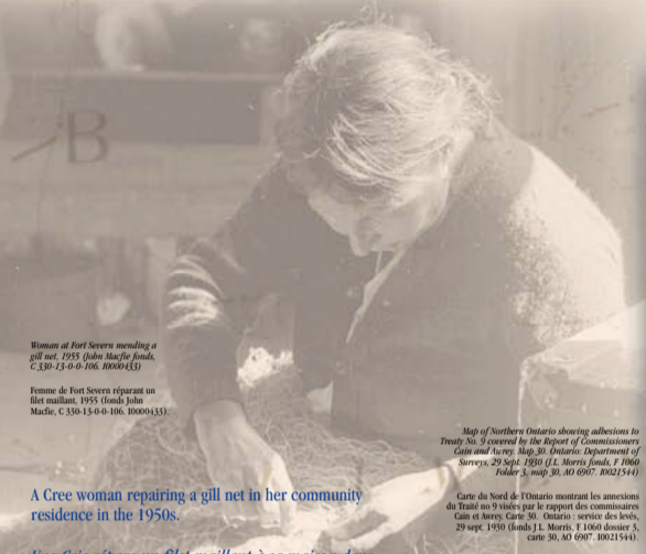
Woman at Fort Severn mending a gill net, 1955

En 1912, on a agrandi l'Ontario de la rivière Albany à sa limite nord actuelle. Puisque l'intérêt pour l'exploitation des ressources s'étendait au nord de cette rivière dans les années 1920, on a officiellement agrandi le territoire visé par le Traité n° 9 en 1929-1930. De nouveau, la commission du Traité a tenu des séances d'information sur le Traité aux postes de la Compagnie de la Baie d'Hudson, mais cette fois, elle s'est déplacée en avion.