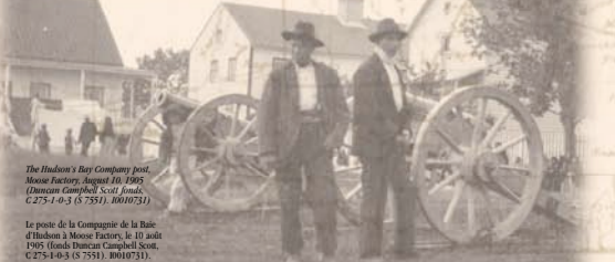
The Hudson's Bay Company post, Moose Factory, August 10, 1905

Préparatifs de la fête suivant la conclusion du premier accord du Traité n° 9 au poste de traite d'Osnaburgh House, au lac St. Joseph (rivière Albany).