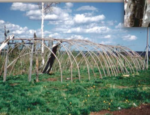
Dancing and feasting lodge, Sandy Lake, 1956

De 1670 à 1880 environ, la traite des fourrures a défini la base des rapports entre Autochtones et Euro-Canadiens. Après 1821, la Compagnie de la Baie d'Hudson a obtenu le quasi-monopole du commerce dans le Nord de l'Ontario. C'est pourquoi elle a joué un rôle logistique clé dans la conclusion du Traité n° 9.