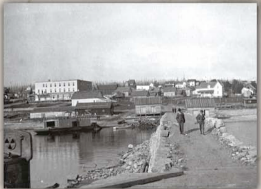
The Village of Haliburton, September 6, 1905 Le village de Haliburton, le 6 septembre 1905

Moose Factory was one of the oldest and most important centres of the fur trade in what is now northern Ontario. Originally founded in 1673, Moose Factory acted as a regional administrative, supply and shipping centre for other posts built on the tributaries of the Moose River.