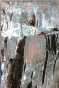
Indian pictograph site in Ferris Lake, Mood Township between Mattagami Lake and Matachewan, September 26, 1958

In addition to archaeological sites, rock paintings provide visually striking evidence of Aboriginal occupation. Aboriginal pictographs depict various aspects of life, and of spiritual relationships to animals and places.