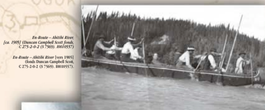
En Route – Abitibi River, (ca. 1905)

En 1905 et en 1906, la commission a parcouru le territoire du Traité n° 9 pour expliquer le traité aux chefs autochtones rassemblés à 14 postes de la Compagnie de la Baie d'Hudson. La Compagnie a fourni à la commission des canots, des provisions et des guides expérimentés, dont bon nombre étaient des « voyageurs » qui accompagnaient les brigades des fourrures sur certaines rivières.