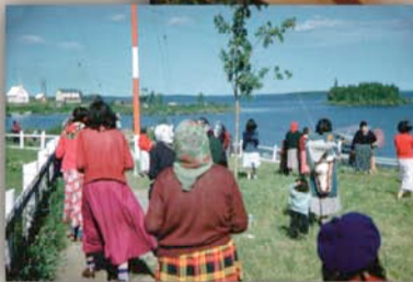
Des membres de la bande de Fort Hope observent un hydravion arrivant à l'embarcadere de Lansdowne House le jour du traité, en juin 1956

Le jour anniversaire du traité, qui commémore le jour où des ancêtres des Premières nations ont signé le Traité n° 9, est une importante confirmation annuelle symbolique des rapports établis par le traité.