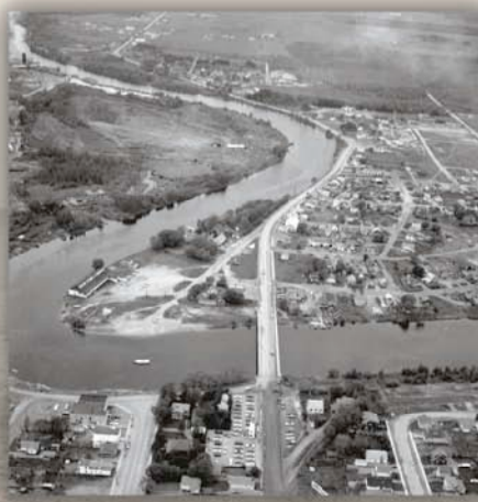
Mattagami River, west of Timmins, from east looking west, June 1968

Au début des années 1970, les Premières nations ont commencé à s'organiser sur le plan politique pour présenter leurs préoccupations et besoins collectifs aux gouvernements fédéral et ontarien. En 1973, les quelque 45 collectivités visées par le Traité n° 9 ont créé à cette fin l'organisme ombrelle appelé Grand Council Treaty N° 9. Maintenant appelé nation Nishnawbe-Aski, l'organisme cherche à développer les rapports établis avec la Couronne par le Traité n° 9.