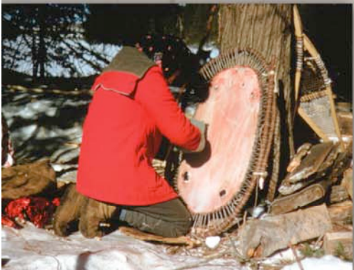
Woman of the Echum family flaking a beaver pelt and sculpting it during the 'frost drying' process, near Gogama, 1955