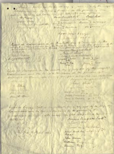
James Bay Treaty (Treaty No. 9), page 5, Miscellaneous collection, F 775. (1905) Item 13

Le Traité n° 9 a été conclu au cours des étés de 1905 et de 1906. Trois commissaires représentaient la Couronne : Duncan Campbell Scott, Samuel Stewart et Daniel G. MacMartin. L'expédition du Traité n° 9 comprenait aussi deux agents de police et un médecin.