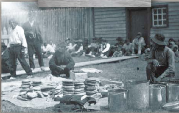
Preparing the feast to be held after the James Bay Treaty signing ceremony, Osnaburgh House, July 22, 1905