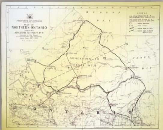
Carte du Nord de l'Ontario montrant les adhesions du Traité n° 9 visées par le rapport des commissaires Gair et Avery, Carte 30, Ontario : services des levés, 29 sept. 1930 (fonds J.L. Morris, F.1060 dossier 3, carte 30, AO 6907, 10021544)

The adhesions to Treaty No.9 in 1929 and 1930 extended the Treaty territory to cover the lands added to Ontario in 1912.