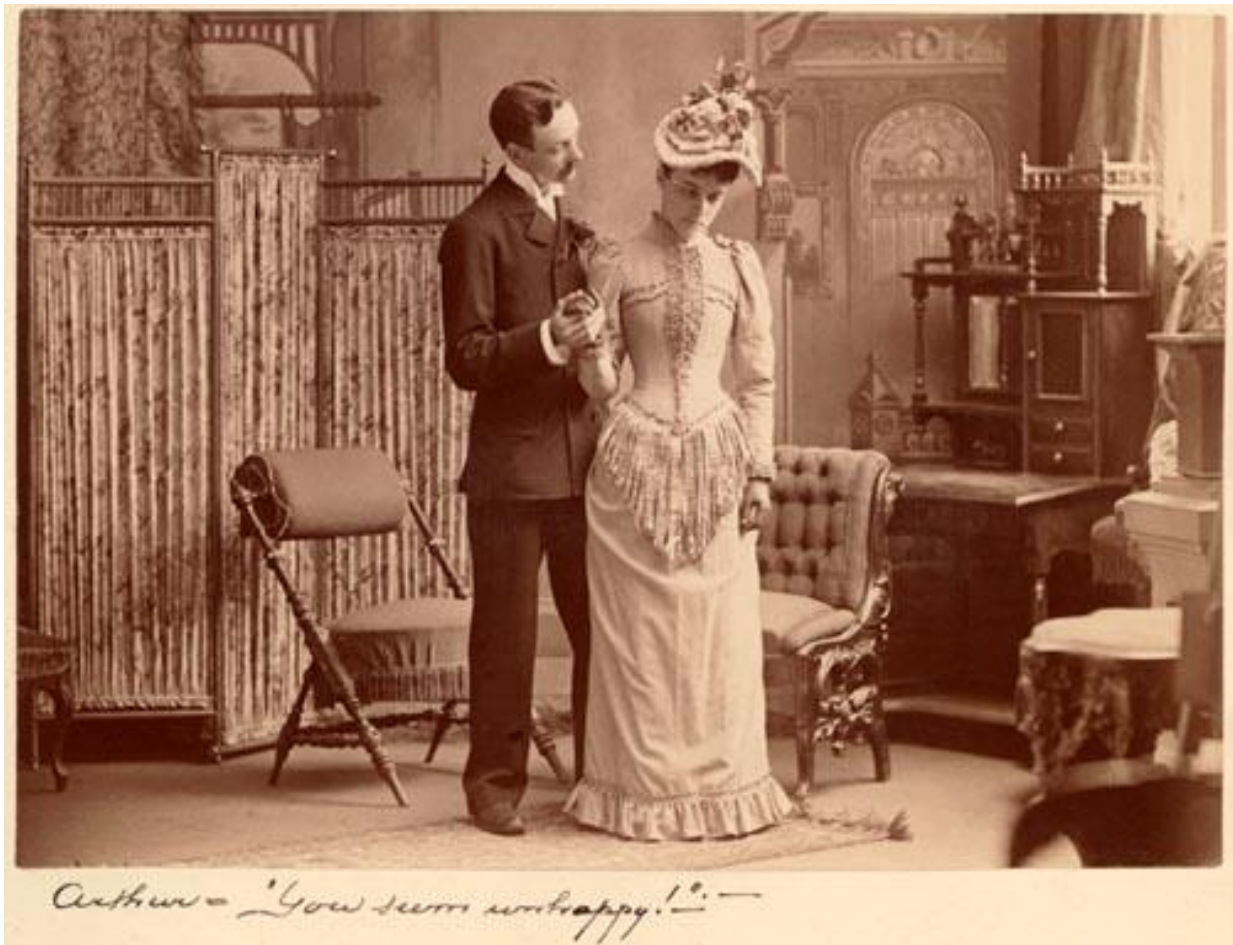
Acte II – Arthur – "You seem unhappy!"; Distrust, [ca. 1892]