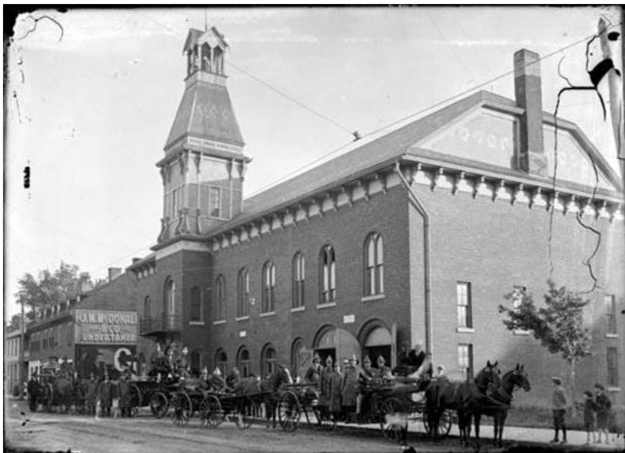
Les pompiers dans la rue devant l'hôtel de ville de Cornwall C 130-1-0-8-9