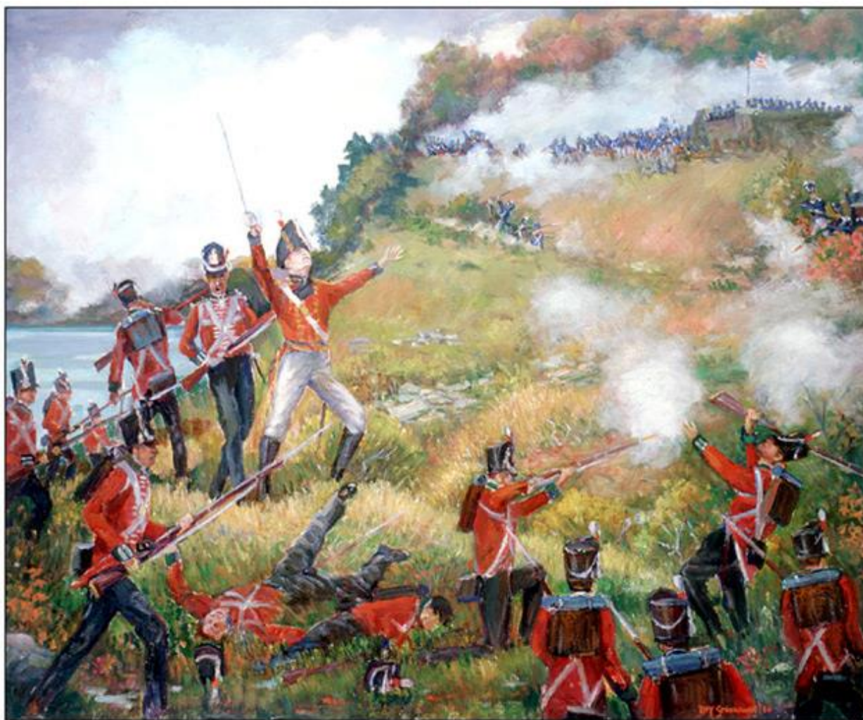
The Death of Brock at Queenston Heights, [vers 1908] C. W. Jefferys, Collection d'œuvres d'art du gouvernement de l'Ontario, 619871