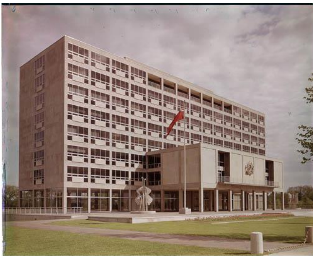
Nouvel hôtel de ville, Ottawa, 1959 RG 65-35-3, 11764-X3520 Photographies de promotion touristique