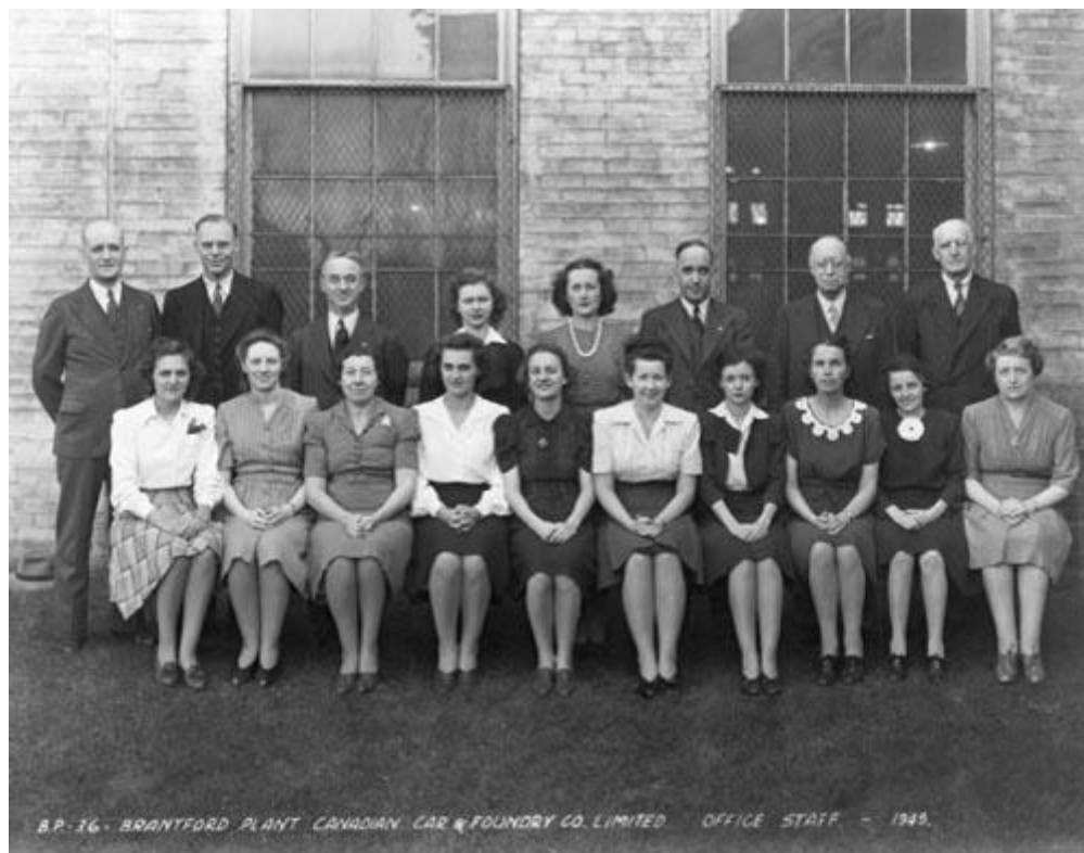
Personnel de bureau, 1945