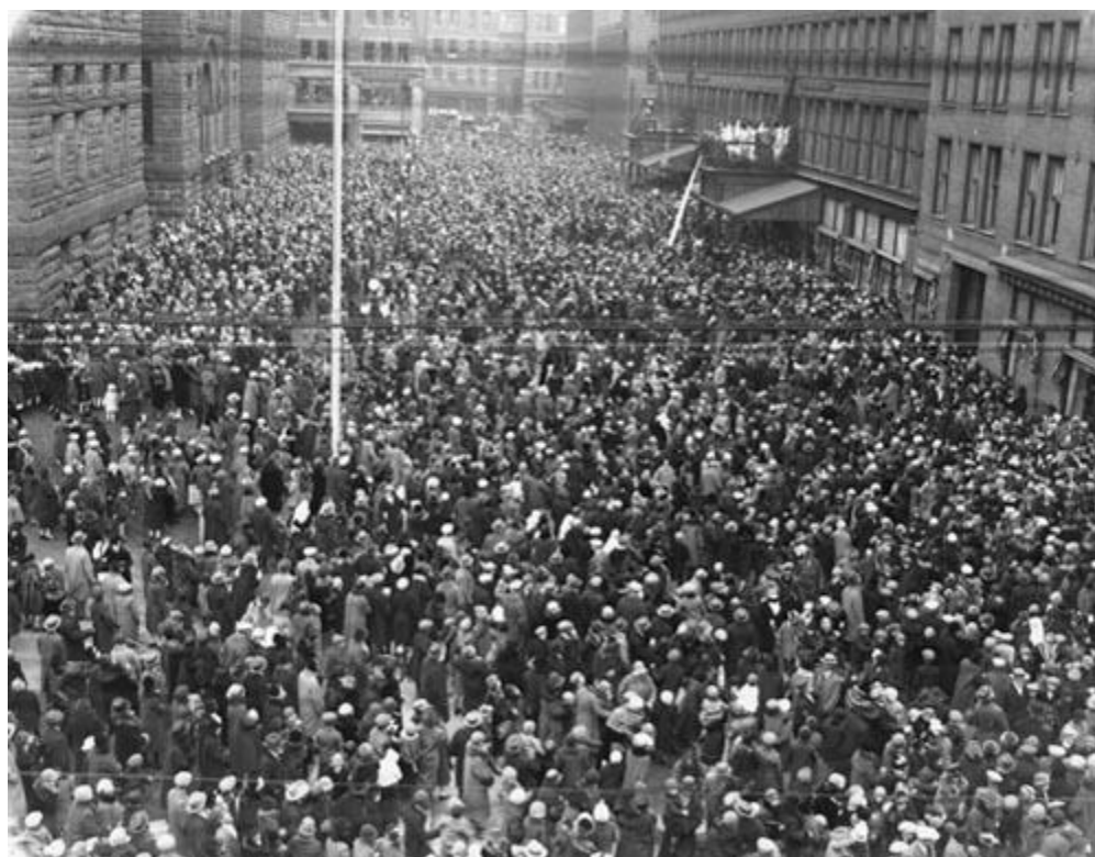
Vue aérienne d'une foule, 1926 F 229-308-0-807, I0020435 Fonds T. Eaton Co.