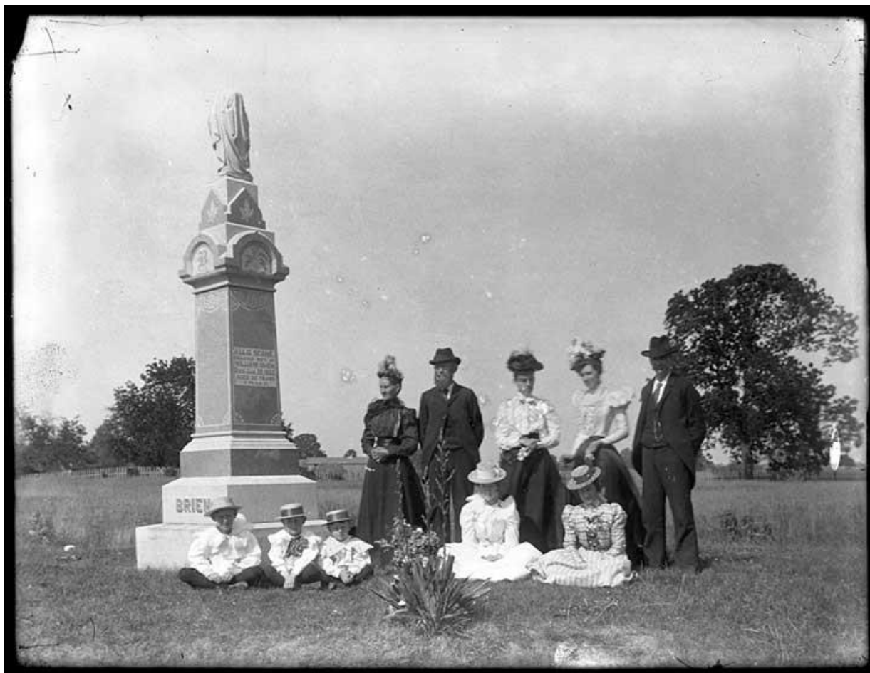
[Hommes, femmes et enfants à côté de la pierre tombale de la famille Brien]