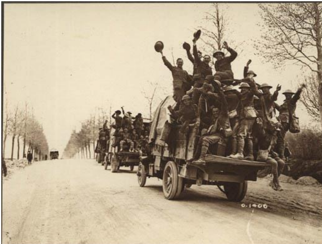
Des soldats canadiens célèbrent leur victoire à Vimy C 224-0-0-9-41