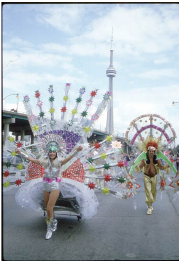
Le défilé de Caribana, années 1970 ou 1980 RG 14-151-3-149, I0005829 Dossiers par sujet de diapositives du ministère des Transports